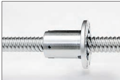
Perfektes Zusammenspiel zwischen Spindel, Mutter und Kugeln: Kugelgewindtrieb Carry Typ KGE 16x16 MSX.

Temperaturen von - 50 °C bis + 90 °C sowie ultraviolettes Licht, Röntgenstrahlen, Teilchen mit hoher Energieladung und atmosphärische Atome, die den verwendeten Edelstahl anfälliger für Korrosion machen.